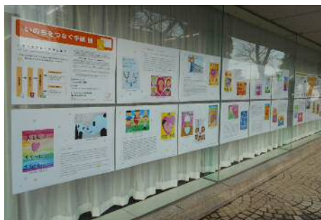
図書館での展示の様子

いのちをつなぐ手紙の便せんは、浜松市内の大型ショッピングセンターや、市役所、各区役所などに置いてあります。また、メッセージやポスターを掲載した本（題名『いのちをつなぐ手紙』）は浜松市内の図書館でお借りいただくことができます。ぜひ、お手に取ってごらんください。なお、 今回、ご応募いただいたみなさんは3月に開催する「いのちをつなぐ手紙」のイベントにご招待しますので、たくさんの方のご応募をお待ちしています！