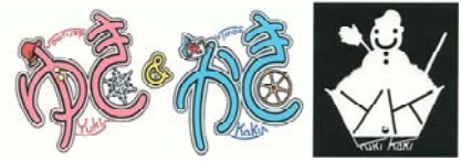
図3 メンバーがデザインした「ゆきかき」ロゴマークとキャラクター

これまでにグループに参加した方は16名（男性11名、女性5名）、平均年齢は27.4歳である。グループがスタートして1年半以上が経過していく中で、就労や新たな目標を見つけて取り組む人、グループの参加を中断する人などがいたため、平成22年度の参加人数は平均5.0人であった。毎回さまざまなプログラムを企画しているが、活動内容はグループミーティングで意見交換をしてできるだけ参加者の声を取り入れたものになっている。参加が中断している参加者などにも「ゆきかき通信」（後述）を定期的に送付し、グループの雰囲気や活動内容を伝えるようにし、いつでも参加できるよう配慮している。