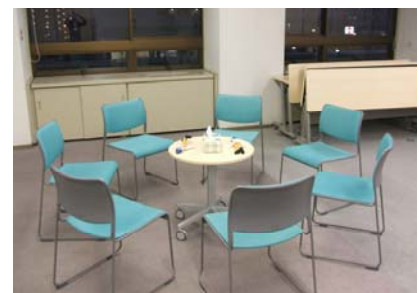
写真1：会場のセッティング