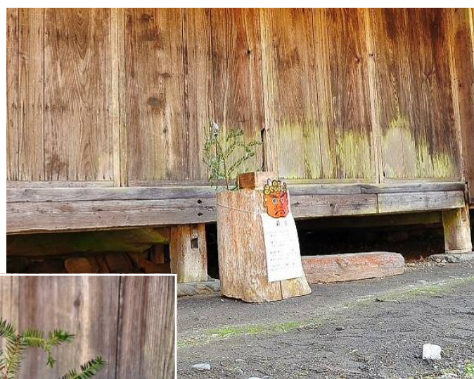
古民家に飾られた節分飾り