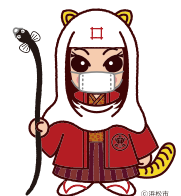
出世法師 直虎ちゃん