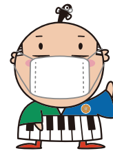
出世大名 家康くん