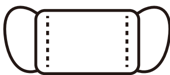
Uso de máscara