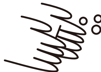
Lavar as mãos