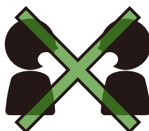
Evitar o frente a frente