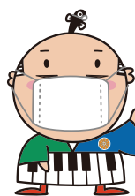
出世大名 家康くん