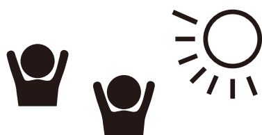
Encontrar com amigos ao ar livre