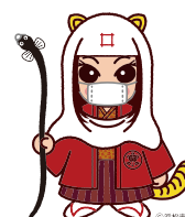
出世法師 直虎ちゃん