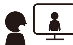
Reunião por videoconferência