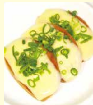
マヨネーズと一味を添えると、よいおつまみに!