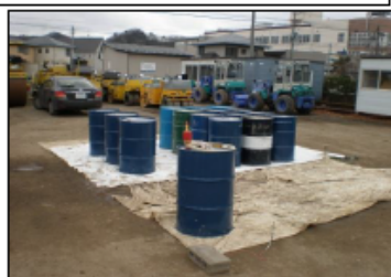
空き地にドラム缶で危険物を貯蔵している様子