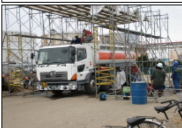
屋外タンクから移動タンク貯蔵所に危険物を移し替えている様子