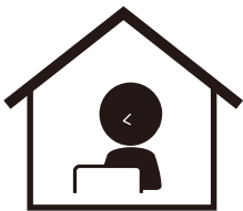
Làm việc tại nhà