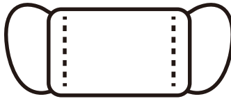
Đeo khẩu trang