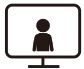
Họp trực tuyến