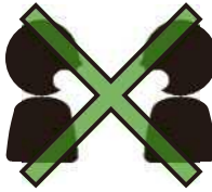
Tránh trực diện