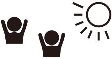
Nếu gặp gỡ bạn bè thì gặp bên ngoài