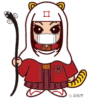
出世法師 直虎ちゃん