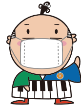
出世大名 家康くん