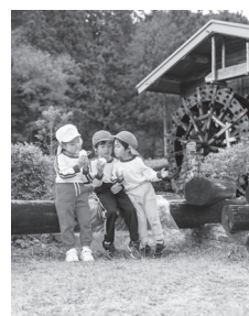
Boletim informativo de HAMAMATSU Janeiro /2026

Este boletim é a tradução parcial do informativo em japonês "Koho Hamamatsu". Todos os telefones para informações são para atendimento em japonês.