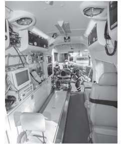
Boletim informativo de HAMAMATSU Dezembro /2025

Utilizar o código QR para acessar o site do Boletim Informativo de Hamamatsu. *O "código QR" é marca registrada da "Denso Wave Inc."