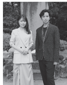
Boletim informativo de HAMAMATSU Junho /2023