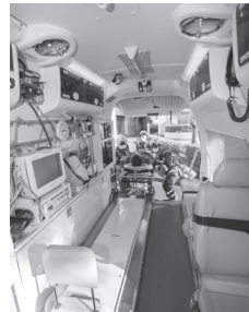
広報 はままつ 2025年12月 表紙

はままつし す ひと かず 浜松市に住んでいる人の数：360,410 はままつし す がいこくじん かず 浜松市に住んでいる外国人の数：16,964 (11月に計算した数です。)