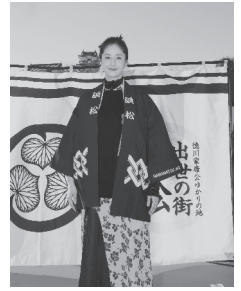
広報 はままつ 2024年3月 表紙

広報はままつに載っている情報は、市のホームページにも載っています。「QRコード」の言葉とマークは、(株)デンソーウェブが権利をもっています。