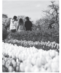
広報 はままつ 2023年4月 表紙

広報はままつに載っている情報は、市のホームページにも載っています。「QRコード」の言葉とマークは、(株)デンソーウェーブが権利をもっています。