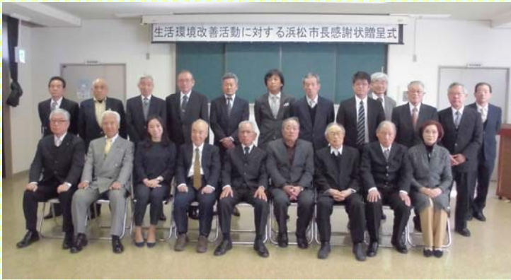
受賞者及び来賓の皆様