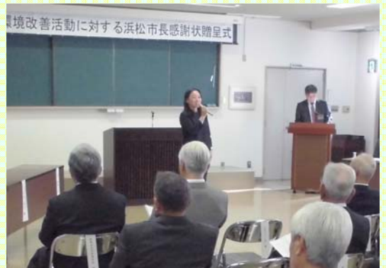
活動内容報告の様子

また、各自治会長におかれましても、来年度以降も各地域で生活環境改善活動に尽力している方について、積極的な推薦をお願いします。