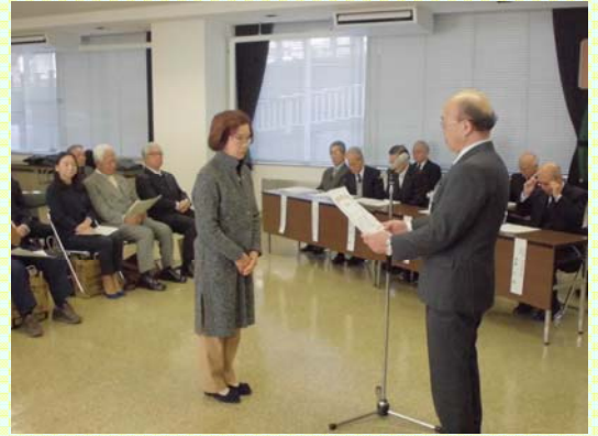
感謝状贈呈の様子

皆さま、おめでとうございます。今後も地域の模範として、引き続き活動の継続をお願いするとともに、環境美化等への変わらぬご理解・ご協力をよろしくお願い致します。