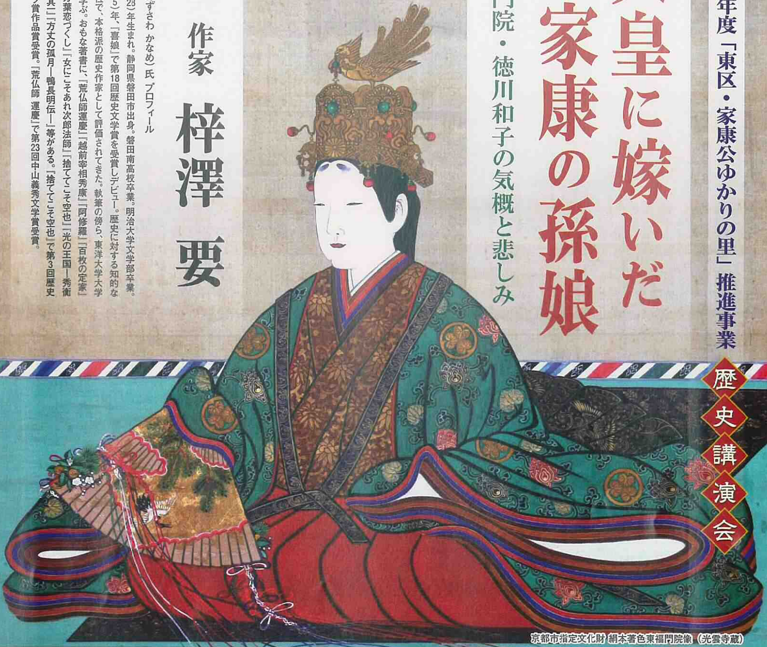
京都市指定文化財 絹本着色東福門院像（光雲寺蔵）

1953（昭和28）年生まれ。静岡県磐田市出身。磐田南高校卒業。明治大学文学部卒業。 1993（平成5）年、「喜娘」で第18回歴史文学賞を受賞しデビュー。歴史に対する知的な洞察とドラマ性で、本格派の歴史作家として評価されてきた。執筆の傍ら、東洋大学大学院で仏教学を学ぶ。おもな著書に、「荒仏師運慶」「越前宰相秀康」「阿修羅」「百枚の定家」「橘三千代」「万葉恋つくり」「女にこそあれ次郎法師」「捨ててこそ空也」「光の王国―秀南と西行」「画狂其」「万丈の孤月―鴨長明伝」等がある。「捨ててこそ空也」で第3回歴史時代作家クラブ賞作品賞受賞。「荒仏師運慶」で第23回中山義秀文学賞受賞。