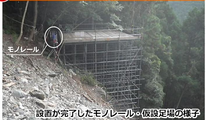
設置が完了したモノレール・仮設足場の様子