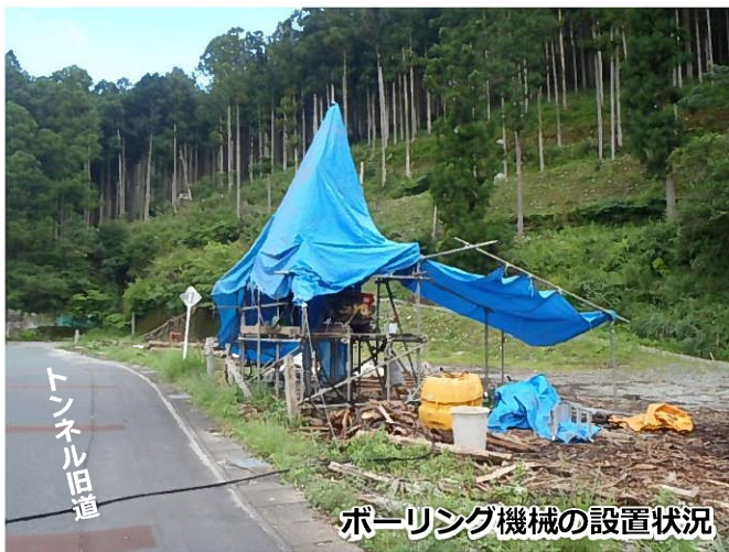
ボーリング機械の設置状況