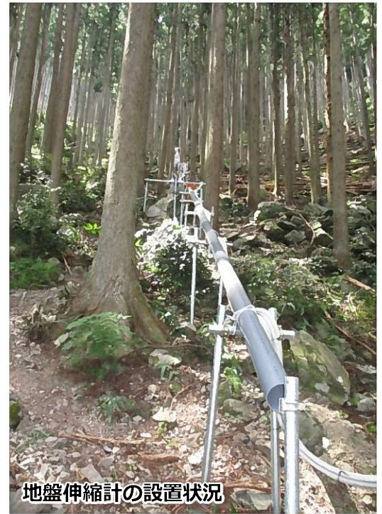
地盤伸縮計の設置状況