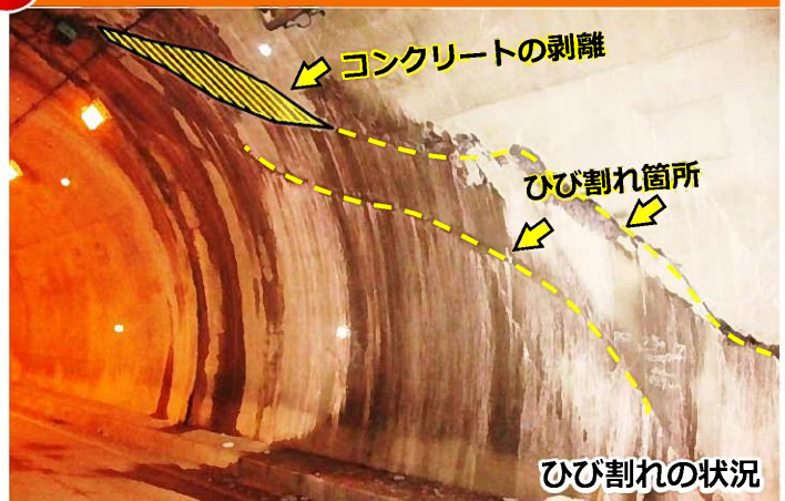
コンクリートの剥離