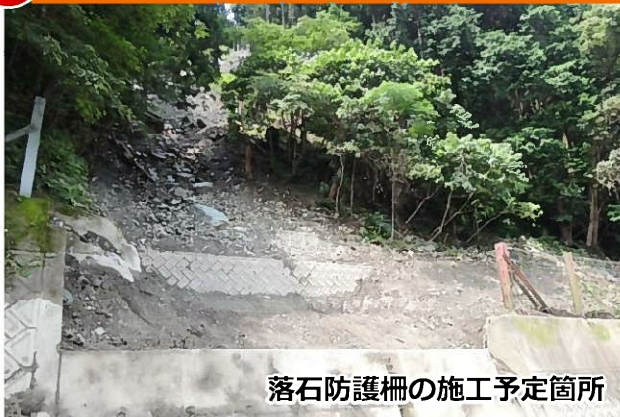
落石防護柵の施工予定箇所