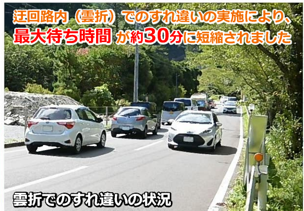
雲折でのすれ違いの状況