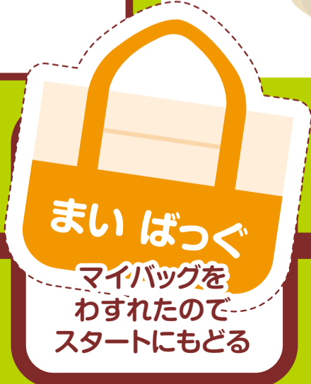
まいばつぐ マイバッグを わすれたので スタートにもどる