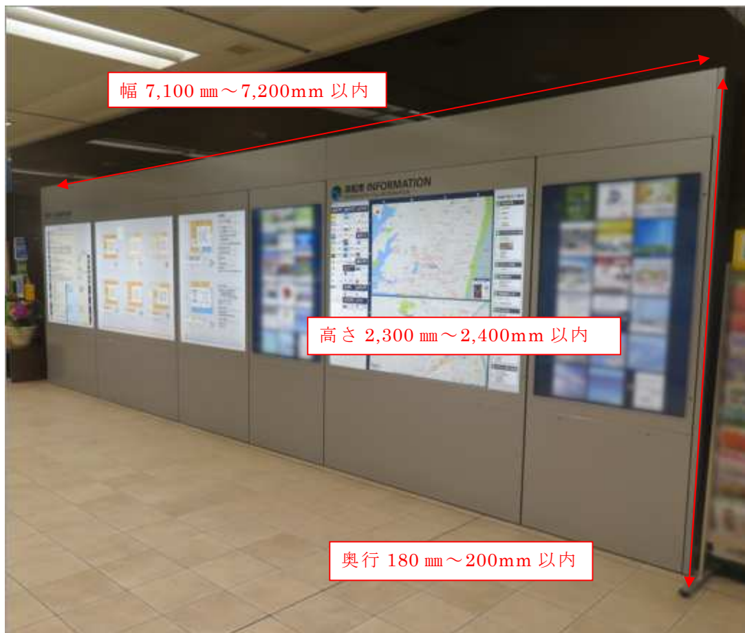
図2 庁舎案内板の現況