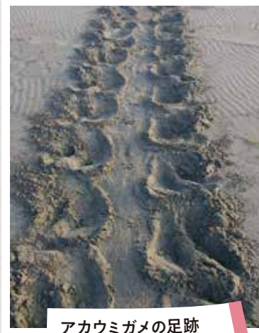
アカウミガメの足跡