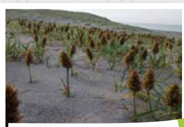
砂浜を成長させるコウボウムギ

アカウミガメ保護のためには、産卵に適した砂浜の維持が求められます。その砂浜の状態を良好に保つためには、海浜植物が適度に