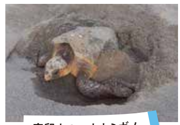
産卵中のアカウミガメ

アカウミガメは神経質な野生動物です。砂浜に上陸したアカウミガメには近づかず、自然な状態で産卵にのぞめるよう、そっと見守ってあげてください。