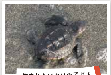
生まれたばかりの子ガメ