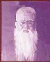
松島十湖翁肖像画 (水野以文画、源長院所蔵)

松島十湖は、嘉永2年(1849年)、遠江国豊田郡中善地村(今の東区豊西町)の生まれ。幼い頃から国学や報徳の道を学ぶとともに、俳諧の道にも進みました。俳句では、生涯約7000に及ぶ多くの俳句を生み、全国に数千の門人を擁し、大正時代には日本俳壇の雄として大いに名を馳せました。