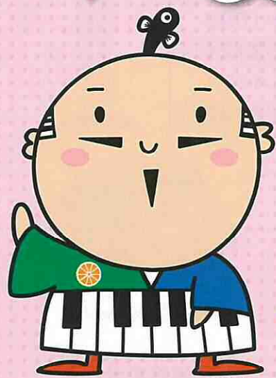
出世大名 家康くん