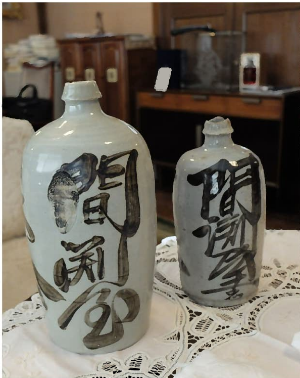
出土した徳利（左）と間瀧商店に伝わる徳利（右） 天守曲輪の上層部分から出土した徳利。現在の間瀧商店にもそっくりの徳利が保管されていました。

浜松城跡で2018年に実施した発掘調査において、お酒等を入れていた徳利が出土しました。大正時代から昭和初期に浜松城の天守台を所有していた間瀧屋（現・間瀧商店）のものとみられます。