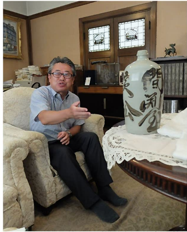
間瀧商店 現社長に話をうかがう 間瀧屋は間瀧商店と名称を変えながらも着町に現存しています。現社長からはお店の歴史をうかがいました。