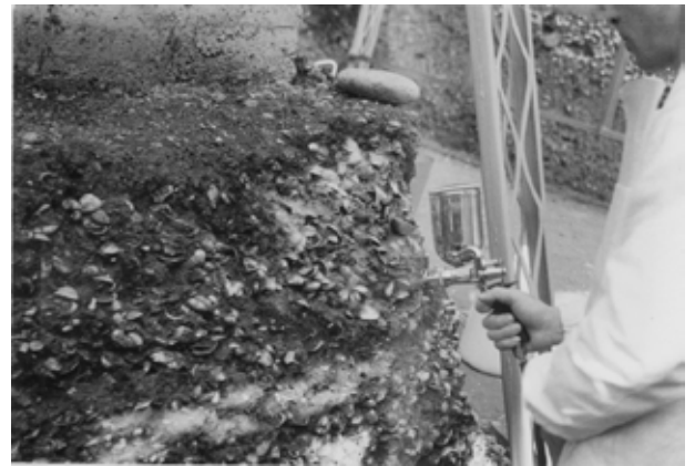
第一貝塚断面の保存処理作業(昭和33年)

発掘調査では、貝塚周辺から建物跡や墓坑が検出され、縄文時代後期を中心とする集落の存在が確認されました。写真からは、発掘調査に併行して復元建物が整備されているのがわかります。