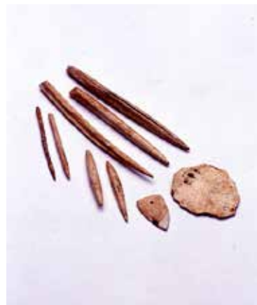
左：蜆塚遺跡出土 装身具類