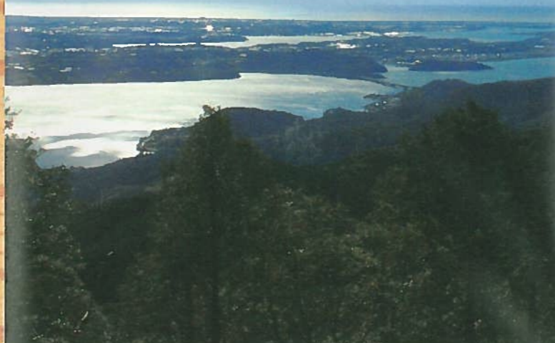
井伊直虎が愛した奥浜名の山々