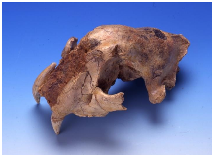
トラ頭骨の化石(根堅遺跡・複製品)