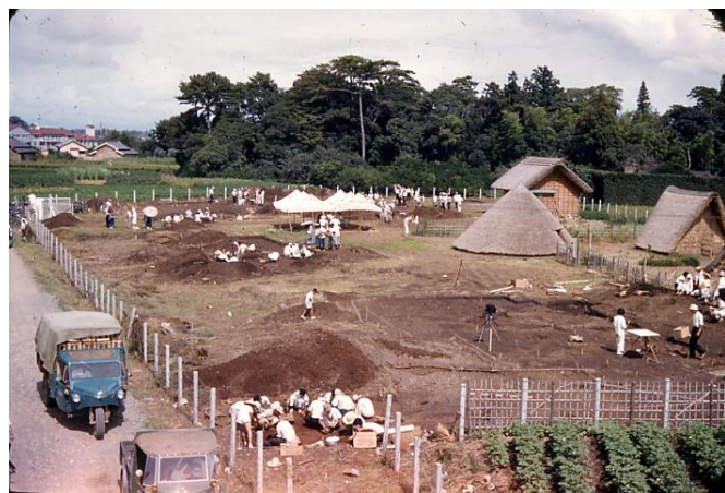
蜷塚遺跡の発掘調査(昭和33年)

蜷塚遺跡は昭和三十年以降に本格的な調査が行われました。4つの貝塚が円環上に並んでいることが分かりました。建物跡、墓地、土器、人骨なども見つかりました。貝塚では、貝殻のカルシウムによって骨、歯などが良い状態で残っています。縄文時代の貝塚は全国に二千以上あり、研究が進んでいます。人骨を調べることで、当時の人々の食生活や自然環境も分かります。蜷塚遺跡でこれまでに行った調査は遺跡の一部に過ぎず、中央部は広場と考えられていたため調査されていません。貝塚は、ごみ捨て場と言われていますが、建物の跡や埋葬された人骨も見つかっています。これは、居住空間やお墓としても使われていたことを物語っています。貝塚が「送りの場」のような精神的な意味合いを持っていたと考える研究者は多くいます。