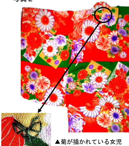
▲菊が描かれている女兒の一つ身 (昭和初年)

「祝つ」とは、めでたいことを喜び、幸運を祈ることです。子どもの祝いのについては、宮参りをはじめ、お食い初めや三歳、五歳、七歳の祝いというように、多くの儀礼が行われていました。昔、子どもは無事に育つことが難しく、「子どもは神からの授かりもの」「七つまでは神の子」という言葉が示すように、七歳までは神と人との間の存在とされていました。そのため、子どもの健やかな成長を祝い、災厄から子どもを守るための儀礼が段階的に行われてきました。子どもの祝いで身に付けるものや贈られるものには、「喜び、幸運を祈る」気持ちが込められています。