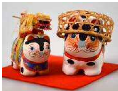
▲笹かぶり犬(右) でんでん太鼓を背負った 犬張子(左) (「博物館情報313号」でも紹介)

出産祝いや初宮参りの贈り物とされる犬張子には、笹(ざる)やでんでん太鼓を背負ったユニークなものもあり、そのかたちには意味があります。水通しが良く、犬に竹かんむりで「笑」という字に似ていることから、鼻つまりせず、元気で笑顔の絶えない明るい子に育って欲しいという願いが込められた笹かぶり犬。でんでん太鼓を背負った犬張子には、裏表のない子供に育つようにという意味があります。