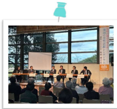
男性の視点で考える、 地域の女性活躍シンポジウム