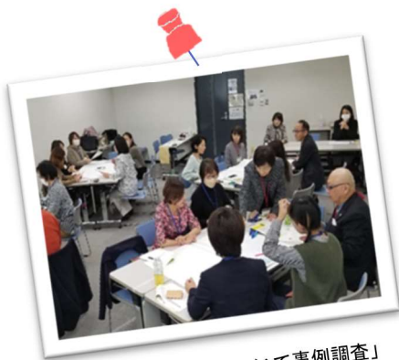
「女性の昇進意欲について事例調査」 インタビュー・グループワーク

浜松市HPから様式をダウンロードし、必要事項を記入して下記担当まで 提出してください。