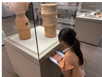
「ふれてみよう！考古学の世界」の様子

幅広い世代の方に文化財や歴史を身近に感じ、楽しく、深く知っていただけるよう、地域の歴史遺産を歩いてめぐる「へりさんぽ」や、出土品から読み取ることができる古代の知恵や技術等を体験し、理解を深める「ふれてみよう！考古学の世界」等、さまざまなイベントなどを開催しています。