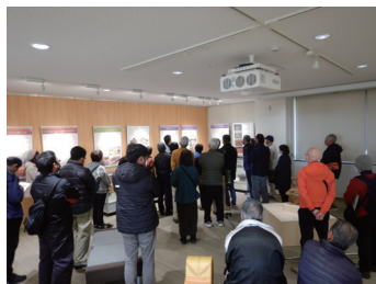
ギャラリートークの様子

発掘調査成果を伝える速報展を開催するほか、地域遺産センターで保管している出土品を中心として、時代やテーマ等を決めて展示し、地域の歴史や魅力を紹介します。また、魅力をより伝えるためのギャラリートーク、講座、シンポジウムなども開催します。