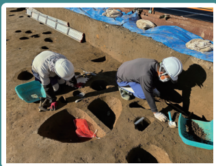
発掘調査の様子（中央区中郡町 万科遺跡）

浜松市地域遺産センターは、浜松市内の埋蔵文化財を中心とした歴史遺産の保存・活用・調査・研究を行っています。また、展示やイベント等を通じて浜松市内の歴史情報を紹介しています。