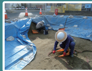
発掘調査の様子（中央区高塚町 高塚遺跡）