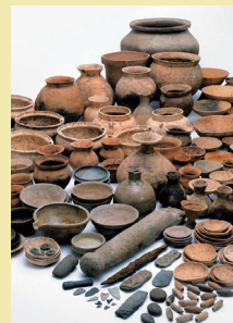
北神宮寺遺跡（浜名区神宮寺町）出土遺物

センターで保管している出土品から、近年の発掘調査成果を交えて展示し、掘り出された浜松の歴史を紹介します。