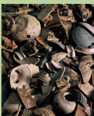
有玉古窯（中央区半田山三丁目）出土須恵器