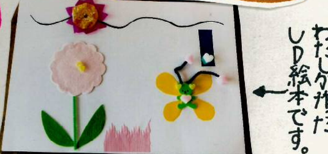
わたしが作ったUD絵本です。