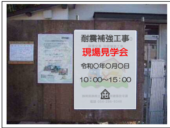
見学会の案内看板