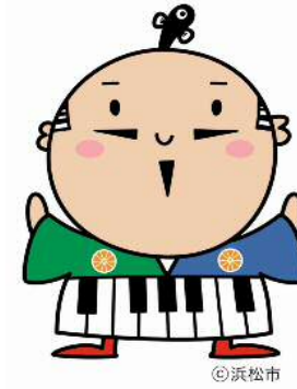
出世大名 家康くん

浜松市では、地震発生時、住宅の倒壊から市民の生命を守るための対策の一つとして、住宅内に比較的安価で設置できる「耐震シェルター」の整備に対する補助事業があります。この制度は、お住まいの住宅に耐震シェルターを設置する際、必要となる費用の一部を補助する制度です。窓口での相談も随時行っておりますので、ご利用ください。