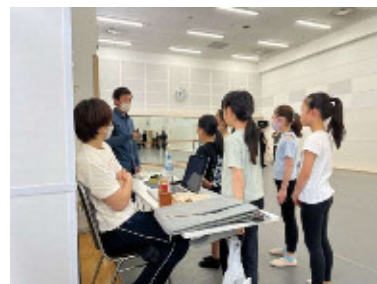
振付師に質問する小学生たち♪