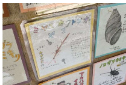
新しく子どもたちが描いてくれました