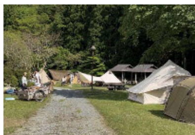
テントがいっぱい♪