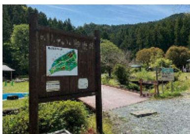
看板も見やすくリニューアル！

ゴールデンウィークが終わると、梅雨が来て、夏季シーズンが来て…と、一年って本当にあっという間だな～と実感します。山いき隊最後の一年、より一日いちにちを大切に過ごそうと思います。