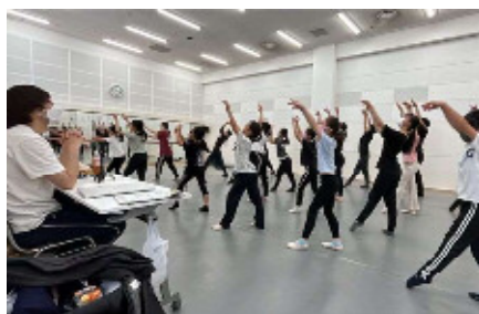
全員で踊ると迫力満点！