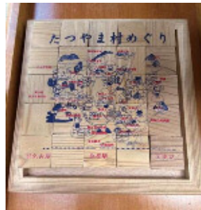
秘密村ロッジに置いてある 「たつやま村めぐり」パズル

羨ましかったのを思い出します。 省シーズンになると、地方の祖父母宅に遊びに行く友人が じ敷地内に住んでいて、母方も都内に住んでいたのが、帰 帰省の一番の目的でしたが。笑 私の祖父母は、父方は同 ととっても大好きなディズニールランドに行くのが、今回の うか。私は四月下旬に一足お先に関東へ帰省しました。 ん、お孫さんが遊びにいらした方も多いのではないでしょ ゴールデンウィークはいかがお過ごしでしたか？お子さ