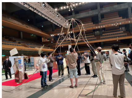
蛸みこしかつぎ体験

オンライン交流会で面識のあった他地域の MAW ホストの方と実際に会ってお話しでき、また山間部で活動されている団体の方とも知り合うことができ、良い機会になりました。さらに、来場者が参加して大きな蛸状のみこしをかつぐ「蛸みこし」が会場内でも特に目を惹き、またチラシやパンフレットの表紙にも蛸のイラストが掲載されていたのが印象的でした。来場者参加型の印象的なコンテンツを取り入れることで、身をもってアートを楽しめて、記憶にも残るイベントになっていたように感じます。今後アートイベントを龍山で実施する際には、このようなコンテンツを取り入れられたらいいなと思いました。