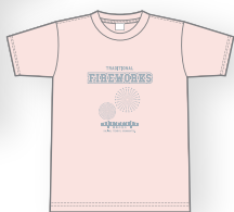
スモーキーピンク