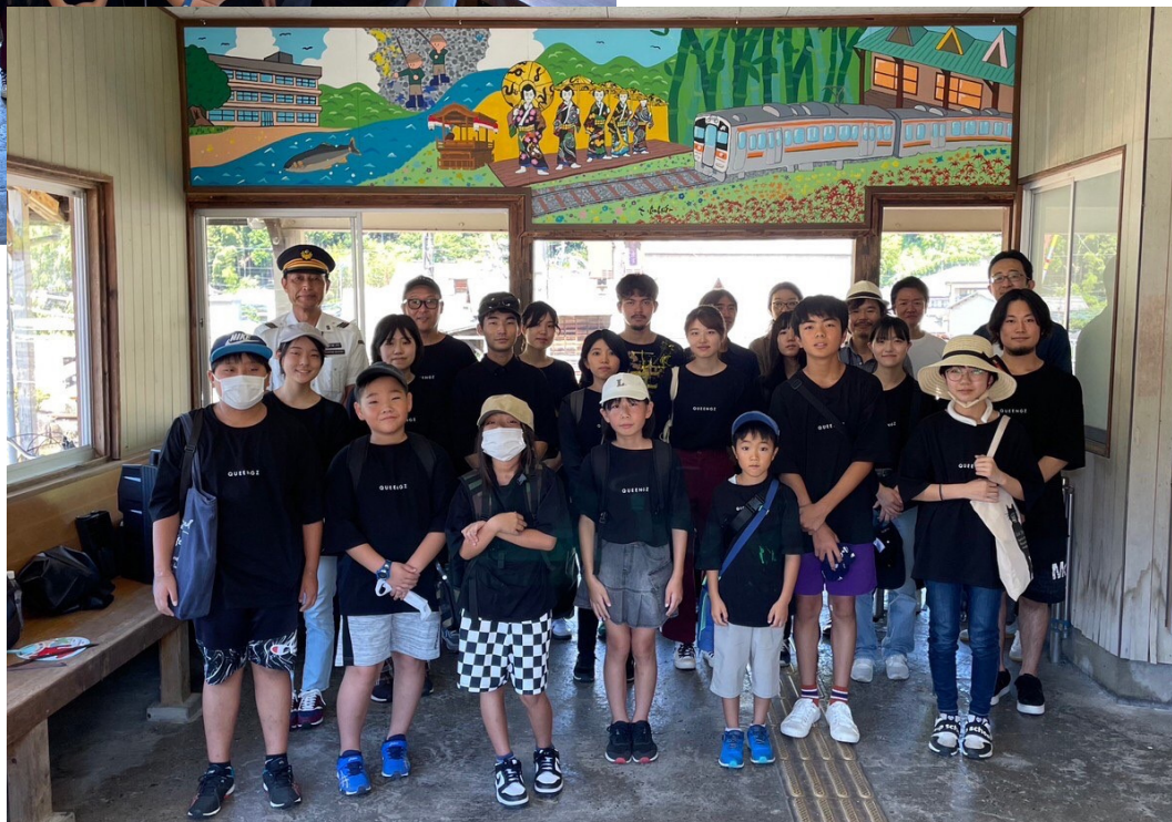
駅のホーム側の壁画→