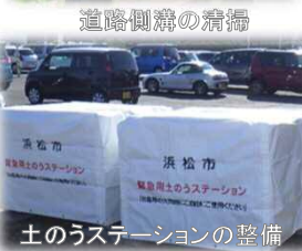
土のうステーションの整備