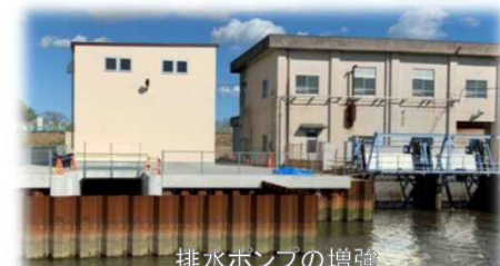
排水ポンプの増強

排水ポンプの更新を実施しました。高塚川の水を馬込川へ多く排水できるようになりました。