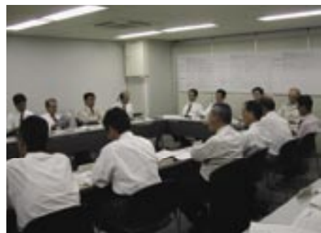
【環境基本計画策定庁内検討会】