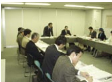
【環境基本計画策定市民検討委員会】