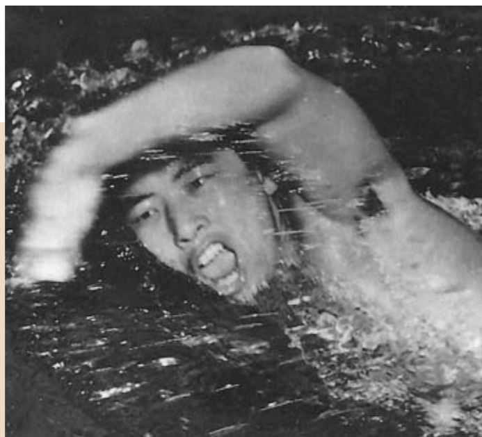
Furuhashi Hironoshin 古橋廣之進 (1928~2009)

浜松二中(現・浜松西高)→日本大学→ 日本水泳連盟第7代会長→ 日本オリンピック委員会第13代会長