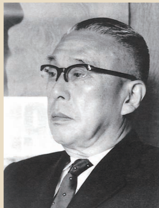
Tabata Masaji 田畑政治 (1898~1984)

日本水泳界に革新をもたらした浜松出身の英雄。それは東京オリンピック開催のキーマンだった「田畑政治」と「フジヤマのトビウオ」と称賛された天才スイマー「古橋廣之進」だ。2019年の大河ドラマ「いだてん」は、1912年の日本のオリンピック初参加から1964年の東京オリンピックが開催されるまでを描いたもので、主人公の1人として田畑政治が取り上げられる。彼を師として仰ぎ、大活躍したのが古橋だ。2020年の東京オリンピックを控えた今、注目したい2人である。