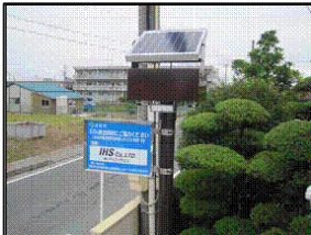
▲設置されたLED街路灯 (天竜中学校)