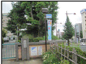
▲設置されたLED街路灯 (元城小学校)