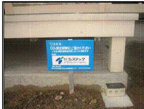
▲設置されたLEDフットライト (エコハウス)