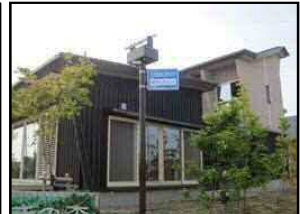
▲設置されたLED街路灯 (エコハウス)