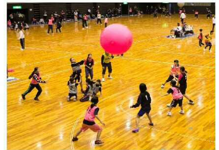
キンボールスポーツ大会

キンボールスポーツ教室や審判講習会の実施により、スポーツ振興及び各地域間の親睦をはかります。また約30チームが参加するキンボールスポーツ大会は9回目を迎え、本年度も浜松アリーナでの開催を予定しています。