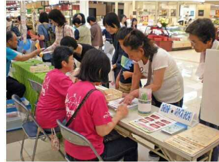
健康力アップ in 東区