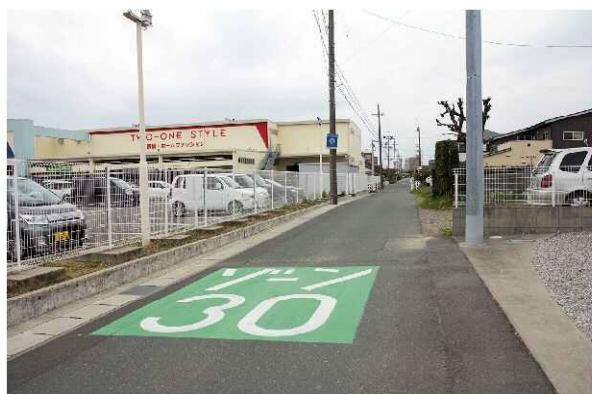
ゾーン30（横志地区実施箇所）

交差点における即効性の高い対策や、多発する高齢者事故削減を目的として、「ゾーン30」による生活道路対策を浜松東警察署と連携して行います。速度抑制による重大事故の減少や交通規制による生活道路に流入する通過車両の排除など、総合的な対策を実施します。