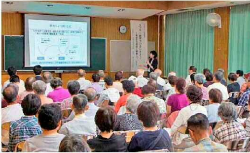
浜松医科大学との連携事業