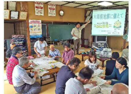
防災出前講座（龍光町自治会）

各地区にて積極的に出前講座を行い、災害発生時に、市民一人一人が自主的に行動できるよう、防災意識の普及・啓発に努めます。さらに大型商業施設を利用した啓発活動の実施や災害時に使える災害対応リーフレットを作成し、全戸配布します。