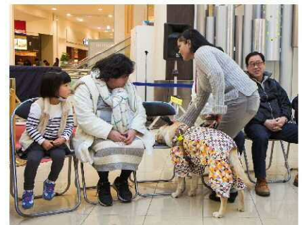
すまいるフェスタ in 東区

東区内の大型商業施設を利用し、「おじいちゃん・おばあちゃんのための作品展」、「東区交通安全フェア」、「すまいるフェスタ in 東区」等様々なイベントを通じ、各種啓発を行っています。