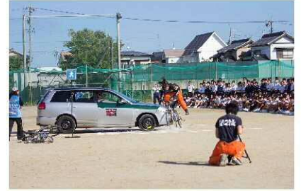
スタントマンの実演による 自転車教室（与進中学校）

今年度は横断幕を用いた交通安全啓発事業をはじめ、交通安全ワンポイント講座、東区交通安全フェア、街頭広報等の啓発活動、中学生や地域を対象としたスタントマンの実演による自転車教室等の実施により、交通事故の削減を目指します。