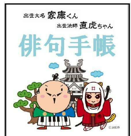
H29 俳句手帳イメージ図

東区には、多くの句碑があり、同時に多くの俳人をも輩出した地域特性を活かし、今後も地域に俳句を定着させるため、第十回「十湖賞」俳句大会や小・中・高等学校での俳句講座を開催します。さらに、今年度が十周年となるため記念講演会の開催や、直虎ちゃん仕様の俳句手帳の作成、一般配布を行うことでより一層、歴史と文化の香るまちづくりを推進します。