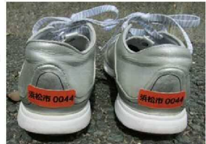
徘徊高齢者用の靴シール

徘徊高齢者をいち早く発見・保護する仕組みである靴用シール（オレンジシール）の配布や不明者情報のメール配信（オレンジメール）登録の周知と普及拡大に取り組みます。