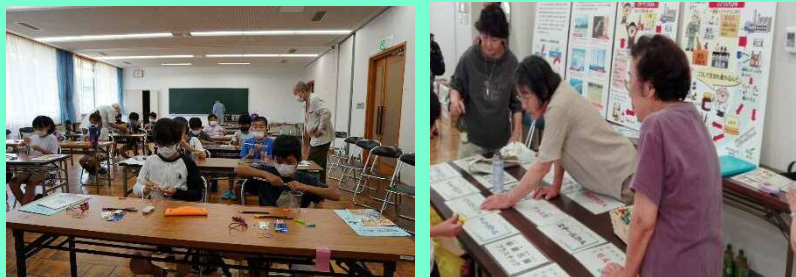
市民向け講座等での講師