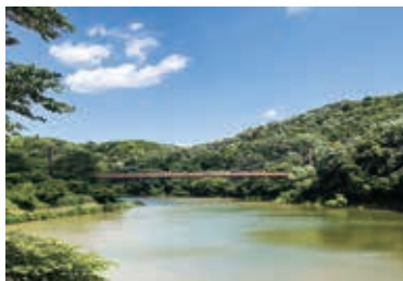
都田川へ流入する増沢調節池(都田総合公園)

職員間で配慮を要する子供を共有し、SSW等を含めたチームによる支援とともに、保護者との情報共有により、家庭と学校の両輪で支援につなげている。今後、子供たちの心の健康状態を把握し、早期支援に努めていく。