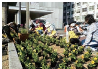
ボランティア団体による市役所の花植えの様子