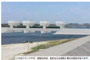
馬込川河口部水門完成イメージ