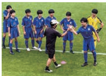
部活動顧問と生徒の触れ合い

※特別自治市：…県・市の二重行政の無駄を取り去り、住民に最も身近な基礎自治体が、事務の一元化による迅速なサービスや、市民ニーズを的確に捉えた施策展開を行う考え方。