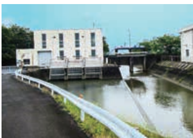
三和第1排水機場(北区細江町)