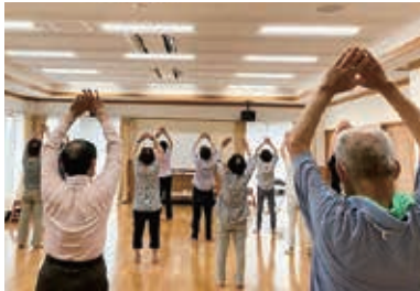
地区社協におけるサロン活動の一コマ