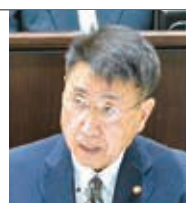
高林 修 自由民主党浜松