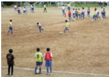
中学校での部活動の様子