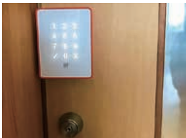
キーレス化を実現する固定型スマートキーの例