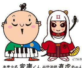
出生大名 家康くん 出せ法師 直虎ちゃん