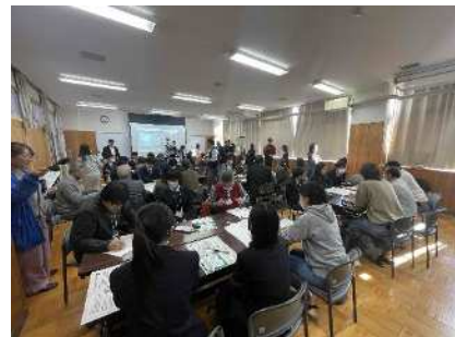
▲R7中山間地域・ミライカレッジの様子

中山間地域で活動する若者、学生等と行政が中山間地域の未来についての意見交換、議論等を行い、中山間地域振興の施策につなげていきます。