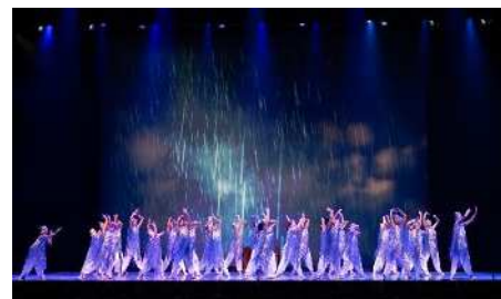
▲第8回森林のまち童話大賞記念公演の様子(アクティシティ浜松大ホール)