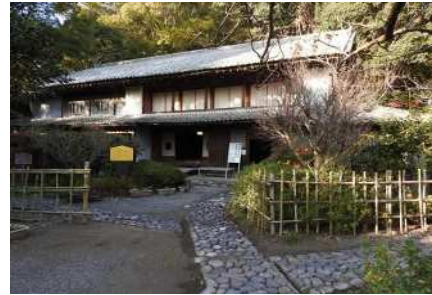
▲旧田代家住宅主屋

国登録有形文化財 旧田代家住宅の価値を維持継承しながら、地域の歴史文化の魅力発信及び、地域住民や観光客の交流の場として安全に活用できるよう検討し、保存修理・耐震工事を実施します。