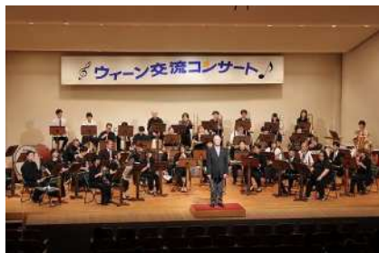
▲ウィーン交流コンサートの様子

世界的に著名なカール・ヤイトラー氏（元ウィーン・フィルハーモニー管弦楽団バストロンボーン奏者）を招聘し、音楽に対するより深い理解と演奏技術の向上、国際感覚の醸成及び音楽文化の推進を図ります。