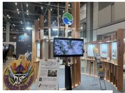
▲ジャパンホームショー2025 での浜松市ブースの様子

大規模展示会への出展や大手企業等への営業活動などにより、天竜材の新たな利用価値を創出し、利用の拡大につなげます。