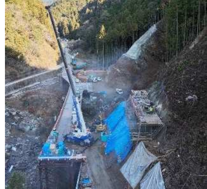
▲国道 152 号(池島～大原)の状況

三遠南信自動車道は、三遠南信地域を結ぶ地域連携の基軸であり、広域交流や物流の活性化、災害時の“命の道”として、信頼性・安定性の高い道路ネットワークを構築する重要な路線です。国道 152 号（池島～大原）の現道改良区間（約 7 km）について、高規格幹線道路をつなぐ区間として道路整備及び雨量規制解除に向けた防災対策を行います。