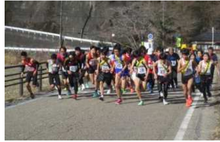
▲天竜区天狗の里駅伝大会(春野)

天竜、春野、水窪地区において開催される駅伝大会を通じて「するスポーツ」「みるスポーツ」「支えるスポーツ」の推進を図り、市民の交流の場として地域の一体感を醸成するため、継続した開催に向けて支援していきます。