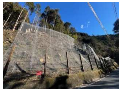
▲道路斜面对策の状況

引き続き、国道 152 号や国道 362 号など中山間地域の道路斜面对策を実施します。