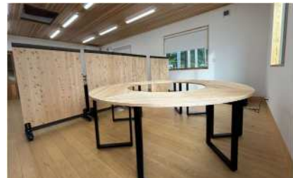
▲製材業者の事務所(天竜区船明)に設置された天竜材(FSC認証材)を使用した木製家具

非住宅建築物での天竜材（F S C 認証材）の活用（新築・増改築・修繕・模様替え及び外構工事の材料費や木製家具の導入費）を支援し、天竜材の地産地消を推進することで、地域の森林資源の循環利用を目指します。