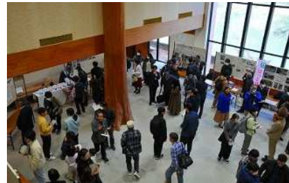
▲R7まちむら交流フォーラム(交流会)の様子

中山間地域、都市部双方のあらゆる年代、個人、企業、団体（NPO法人、地域団体、自治会等）など、様々な主体が一堂に会し、シンポジウム等を通して、中山間地域の魅力や可能性を共有し、中山間地域に関わる人を創出するきっかけづくりを行います。