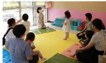
▲児童館「ひよこランド」の様子

子育て親子や児童が気軽に集う児童館を運営し、子育てに関する相談や情報の提供、助言のほか、その他の支援を行うことにより、子育ての不安感等を緩和し、子供の健やかな育ちを促進します。