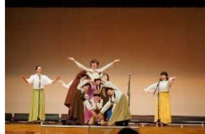
▲次世代アーティスト育成事業 (すみれワークショップミュージカル)

中山間地域の次世代を担う子供たちへ文化芸術に親しむ環境を提供することにより、文化芸術活動の推進及び新たな担い手の育成を図ります。