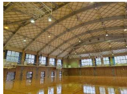
▲LED 化工事予定の水窪総合体育館アリーナ

「浜松市地球温暖化対策実行計画」に基づいて水窪総合体育館及び天竜ボート場艇庫における照明機器のLED化工事を実施し、脱炭素、温室効果ガス削減に向けて取り組みます。