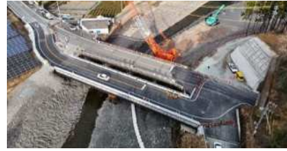
▲篠原橋（仮橋への交通切替後）の状況