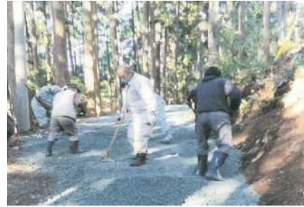
▲原材料支給事業による道路整備の様子

生活環境の向上を図るため、自治会が地域コミュニティ活動の一環として協働で行う整備事業に対して、整備に必要な原材料を支給します。