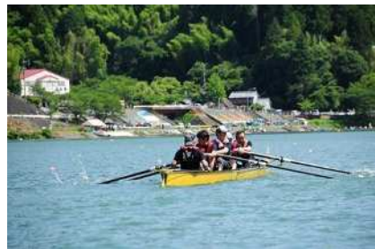
▲ボートフェスティバルの様子

ボート競技を通じて、市民のスポーツ振興及び健康増進に寄与するとともに、「ボートのまち天竜」の推進を図ります。