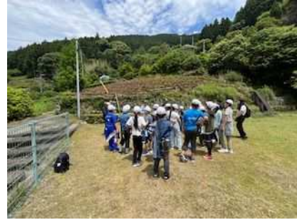
▲子ども中山間地域交流事業(集落探検)

都市部の子供たちが中山間地域を訪問し、地域住民との交流や、地域の生活・文化に触れる体験活動を通して、地域間交流の促進を図ります。