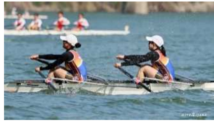
▲第36回全国高等学校選抜ローイング大会 (種目:女子ダブルスカル)