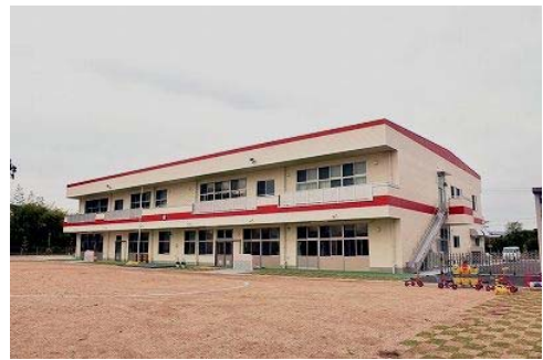
〈平成28年4月に開所した 浜北西保育園〉