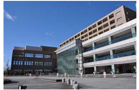
〈平成 28 年 10 月に浜北区役所が機能移転を予定している なゆた・浜北〉

浜北文化センターの空調設備機器の更新工事を実施します。(平成 28～29 年度)