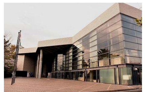
〈更新工事を行う浜北文化センター〉