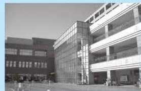
< 区役所が10月から移転する予定のなゆた・浜北 >