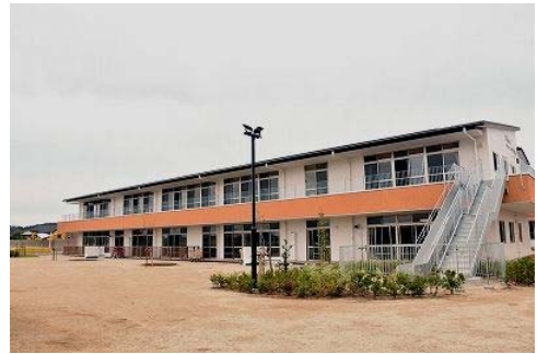
〈平成28年4月に開所した 子育て支援センターかきのみ〉