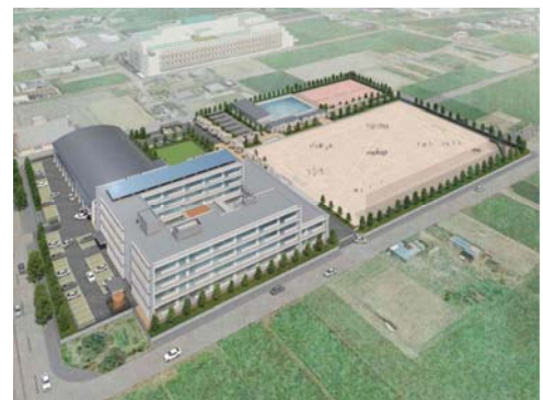
〈浜名中学校イメージ図〉