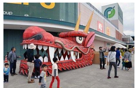
〈地域力向上事業で助成したドラゴンパーティ～飛竜迷路の大冒険〉