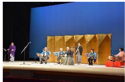
〈浜北区市民文化祭〉

地域の活性化や文化振興のため、市民協働の観点を取り入れて、はまきたグリーンフェスタ、浜北産業祭、浜北区市民文化祭、浜北植木まつりなどを実施します。