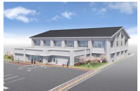
〈平成 28 年度に生まれ変わる浜北体育館のイメージ図〉