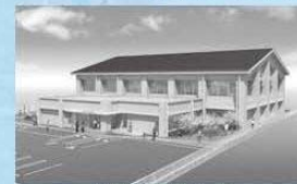
< 完成予想図 >