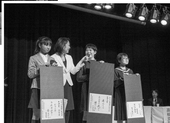
第七回 「十湖賞」俳句大会