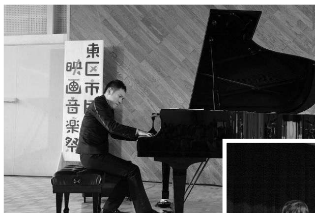
東区市民映画音楽祭