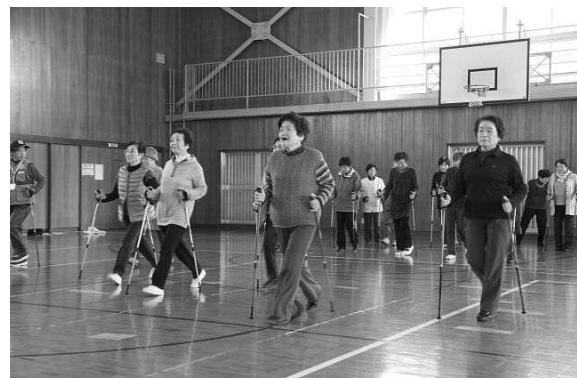
ノルディック・ウォーク