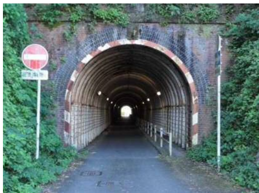
鳥羽山洞門をくぐる

5月16日（土）には、天竜浜名湖鉄道二俣本町駅を起点に、国登録文化財や産業遺産、浜松市指定史跡をめぐる見学会を開催しました。