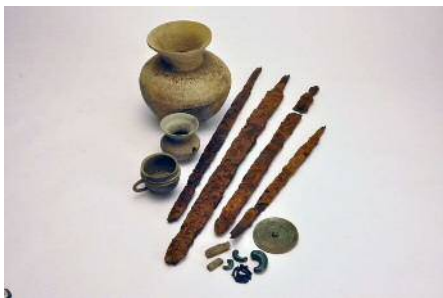
二本ヶ谷積石塚群 土器・副葬品

いまからおよそ1600年前、古墳時代と呼ばれる時期に、朝鮮半島などから多くの人々が日本列島に渡り、渡来文化と呼ばれる新たな生活様式が広がりました。浜松市域にも当時の渡来文化を物語る二本ヶ谷積石塚群（浜北区染地台）が知られ、県指定史跡として整備されています（上写真）。平成27年は史跡整備着工から10周年を迎える記念の年です。