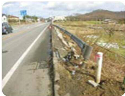
ガードレール・ 標識等の損傷