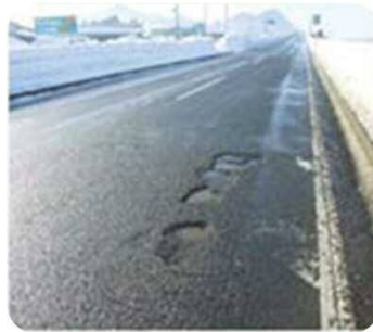
路面の穴ぼこ・ 段差